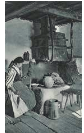
Femeie lângă vatră cu pomnol și babură, România: natură, clădiri, viață populară de Kurt Hielscher, Leipzig, 1933.

Pagina alăturată. Omul, lut însuflețit. Pământul, oale prefăcute, din oale-oameni. Prefaceri nesfârșite. Manualitate și simbol pe șantierul conacului Carp, Iași, în pauza dintre două frământări ale pământului adus din lutăria învecinată.